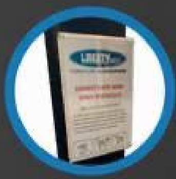
Tabella con indicazioni